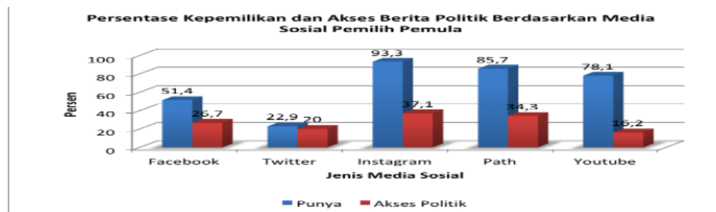
Gambar 1 Persentase kepemilikan dan akses berita politik melalui media sosial pemilih pemula

kepercayaan terhadap sistem politik, dan kampanye kandidat. Apatisme juga menjadi salah satu tantangan besar di kalangan pemilih pemula. Di tengah pesatnya perkembangan teknologi informasi, media digital telah menjadi saluran utama mahasiswa dalam mengakses informasi politik. Data APJII (Asosiasi Penyelenggara Jasa Internet Indonesia) tahun 2023 menunjukkan 98,7% mahasiswa Indonesia aktif menggunakan internet, dengan 89,3% diantaranya mengakses konten politik melalui platform digital. Namun, banjir informasi ini justru menimbulkan masalah baru berupa maraknya hoaks politik, 62% menurut Masyarakat Anti Fitnah Indonesia/MAFINDO 2023) dan rendahnya literasi digital politik.