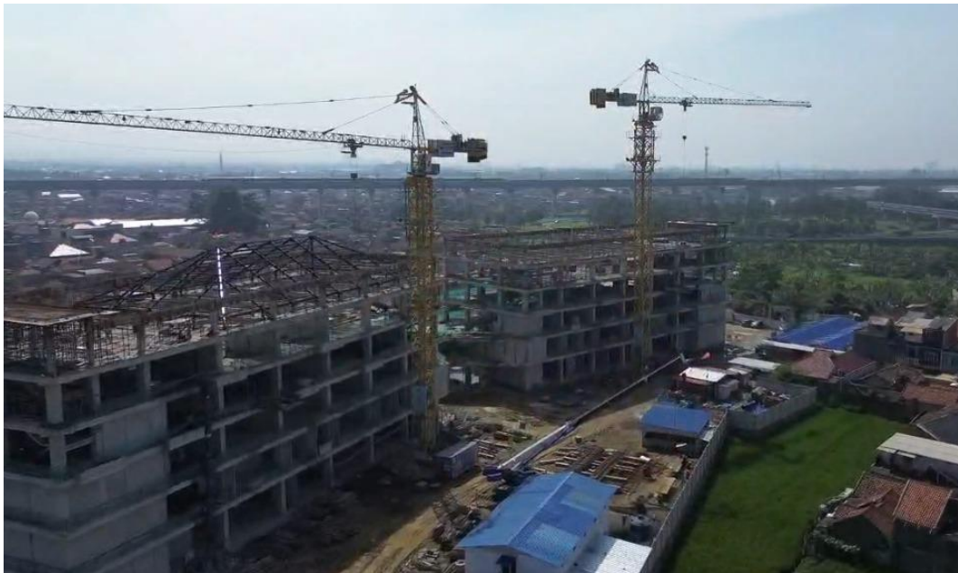
Kampus (2) baru UNUPI yang sedang dibangun