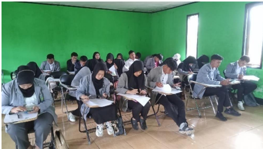
Observasi Lapangan : Seminar tentang Politik