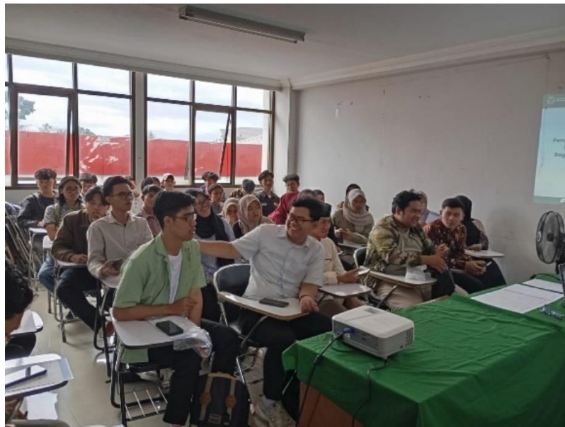
Gambar 17. Fokus Grup Diskusi