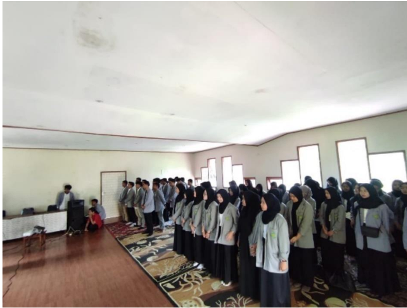
Observasi Lapangan : Diskusi tentang Politik