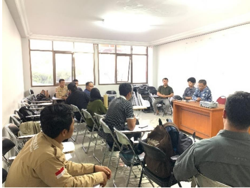
Gambar 18. Fokus Grup Diskusi