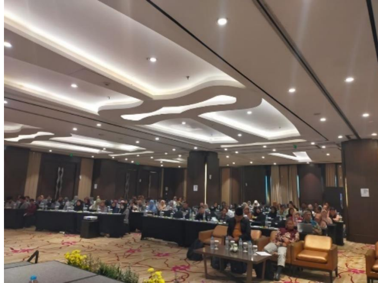
Observasi : Kegiatan Edukasi Politik