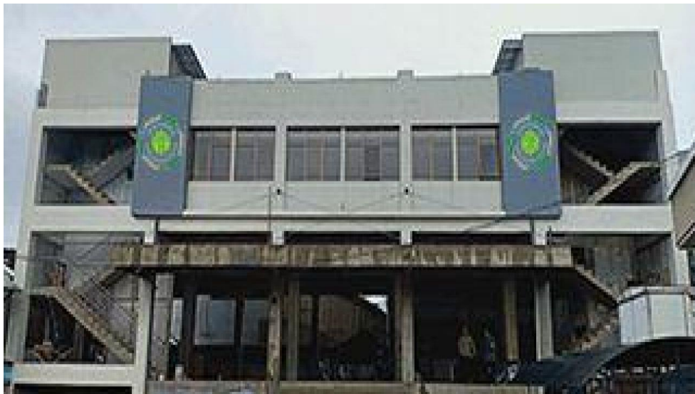
Gedung UNUPI Kampus 1 Jl. Peta 154 Bandung

Observasi pendidikan politik di era digital dalam yang dilakukan pada mahasiswa Universitas Persatuan Islam dilakukan dari bulan September tahun 2023 sampai Pemilu, khususnya menjelang dan pelaksanaan Pemilu 2024. Dan secara khusus dilakukan juga pada hari Kamis tanggal 16 Januari 2025 pukul 08.00-14.00 dan Kamis 23 Januari 2025 08.00-13.00 di Lokasi Kampus UNUPI jalan Peta No. 154 Bandung. Sebetulnya UNUPI sudah memiliki kampus baru di desa Rancamalang kecamatan Margaasih Kabupaten Bandung, hanya masih dalam tahap pembangunan 2 gedung masing-masing 5 lantai, jadi belum bisa digunakan. Sehingga segala aktivitas perkuliahan, administrasi dan yang lainnya dilakukan di Kampus Jl. Peta 154 kota Bandung.